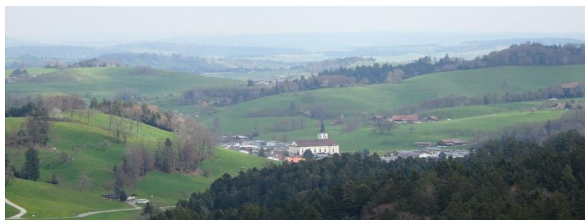
Bild Hergiswil a/Napf