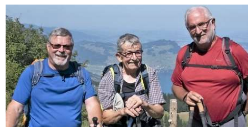
Das Wanderleiterteam 2024:

*Ganzer Tag, **Bergwanderung, ***Halbtageswanderungen