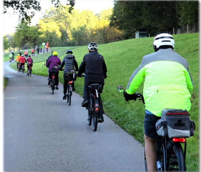
Radtouren ab Mai wieder im Programm, Seite 3