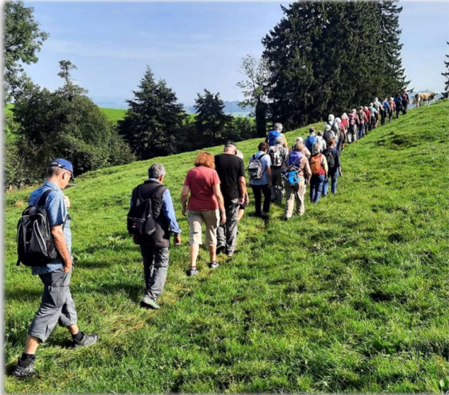
Wir wandern wieder, Programme Seiten 4 + 10