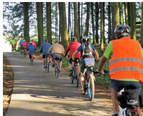
04.09.2023 Tagesausflug Sempachersee